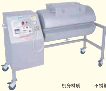
VTS-500型 立式真空滚揉机