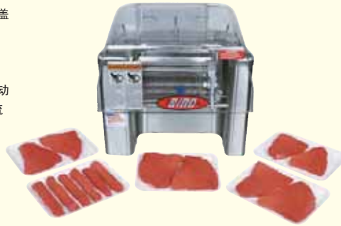
Model PRO-9HD Tenderizer (shown)