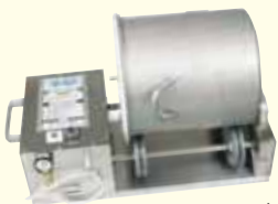
VTS-41 & VTS-42型 台式真空滚揉机