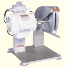
MODEL BCC-100 POULTRY CUTTER