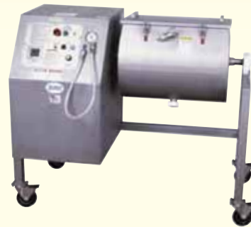
VTS-100型 立式真空滚揉机